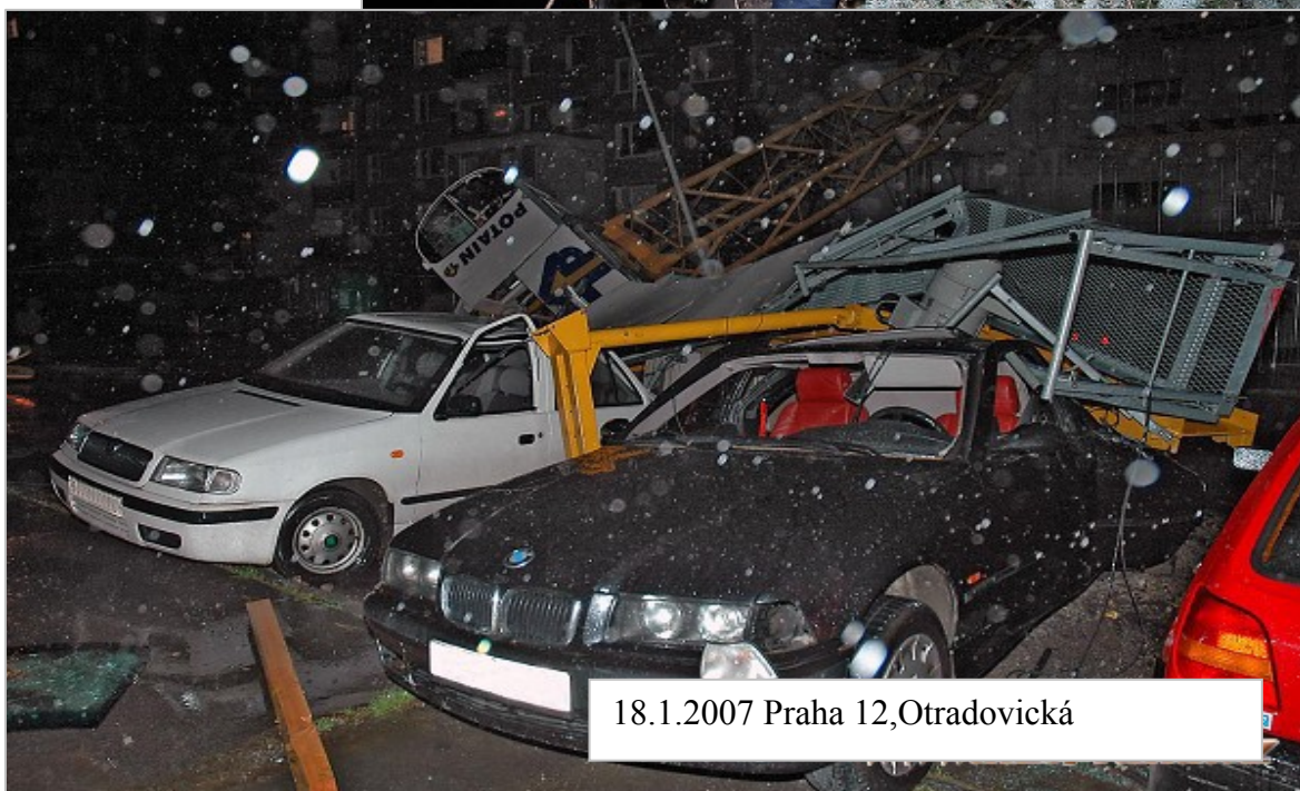
18.1.2007 Praha 12, Otradovická