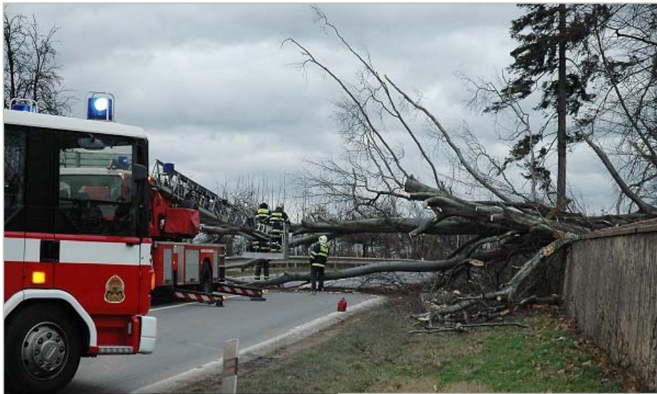
18.1.2007 Praha 22, Přebuz