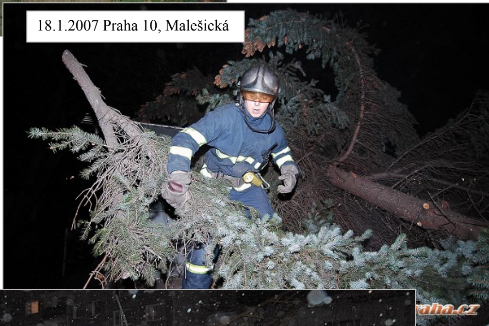
18.1.2007 Praha 10, Malešická